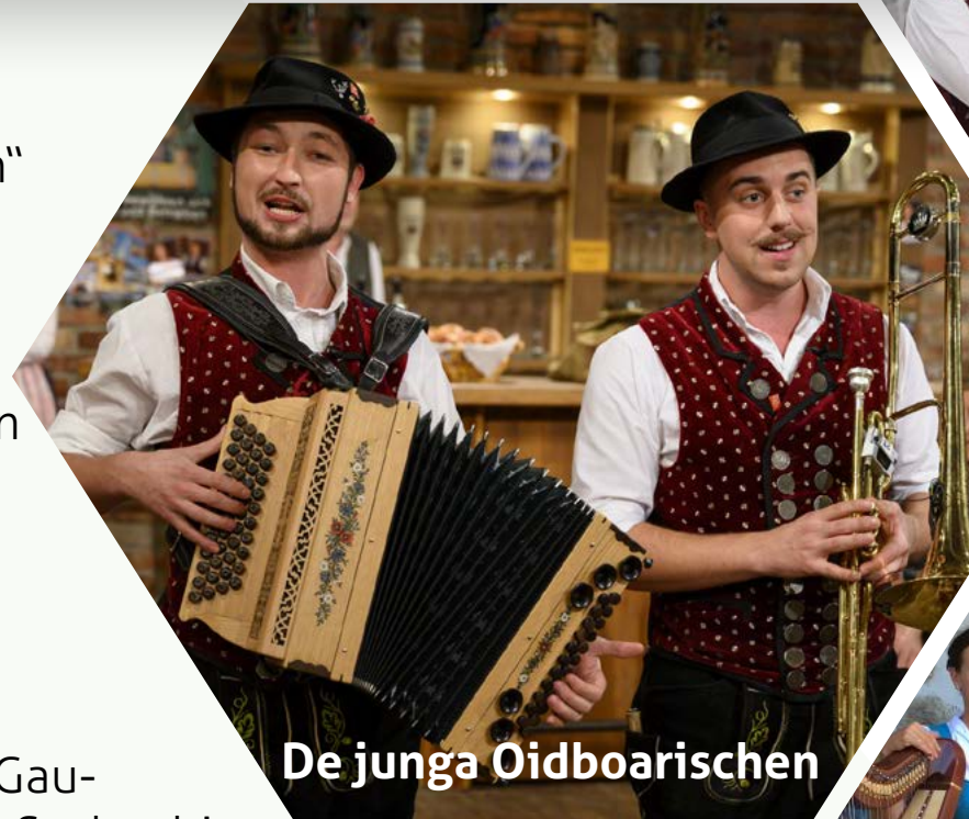
De junga Oidboarischen