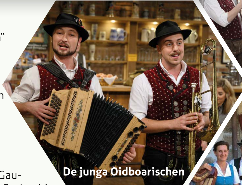
De junga Oidboarischen