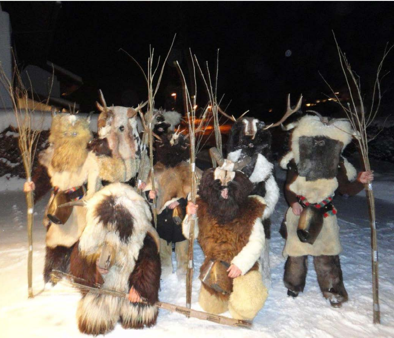
Wolfauslassen im Bayerischen Wald.