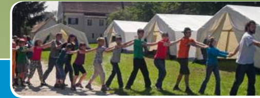
bei Geisenhausen/Lkr. Landshut