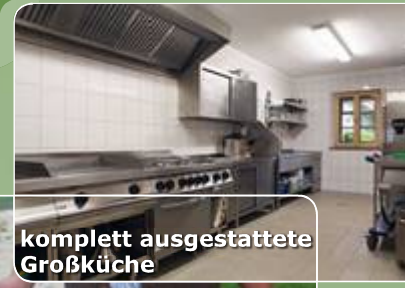
komplett ausgestattete Großküche