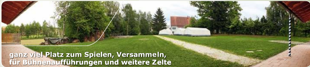
ganz viel Platz zum Spielen, Versammeln, für Bühnenaufführungen und weitere Zelte