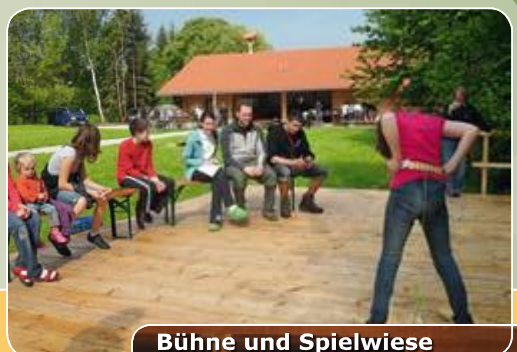
Bühne und Spielwiese

Einen liebevoll angelegten Zeltplatz mit Bühne und Feuerstelle, viel Platz rund um die Zelte, eine ruhige Lage abseits großer Straßen und ein Versorgerhaus mit vielen Möglichkeiten: großer, heller Aufenthaltsraum, geräumiges Notlager für Schlechtwettertage und -Nächte, Betreuerzimmer, Großküche, Lagerräume, Kühlmöglichkeiten, saubere Sanitäreinrichtungen und einiges mehr.